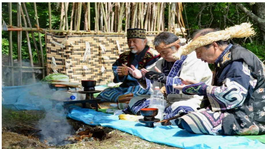
Figura 3 gruppo Ainu

all'interno di questa teoria. Il fattore principale che va a minare le basi della teoria riguarda le caratteristiche molto diverse delle due lingue; possiamo ritrovare elementi della lingua ainu all'interno del giapponese parlato solo in alcune regioni del nord del Giappone (Hokkaidō e Tōhoku) e di alcuni rari prestiti linguistici dovuti alla forzata convivenza di due diverse lingue sullo stesso territorio. Nuovi studi stanno cercando di provare una relazione genetica tra la lingua giapponese e la lingua ainu: mettendo a confronto parole giapponesi, coreane e ainu. Il risultato è riassunto da James Patrie “le caratteristiche proprie delle lingue altaiche riscontrate nella lingua ainu ne provano la sua appartenenza a questo gruppo, andando a confermare che le vaghe somiglianze tra il coreano, il giapponese e l'ainu sono dovute a legami genetici” 9 .