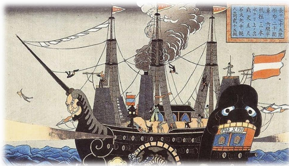
Figura 10 黒船の絵です。

明治時代の前に、江戸時代がありました。これは保守的な時代でしたが、1853年には状況が変わりました。1853年に黒船が来航しました。マシュー・カルブレイス・ペリー 36 のかんたいは1853年7月8日17時に浦賀の港の近くにあらわれ、ていはくしていまし