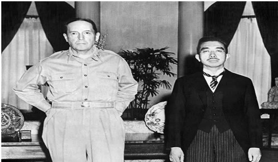
Figura 7 il Gen. MacArthur e l'imperatore Hirohito

guerra che riguardò in massima parte militari; il processo avvenne al Tribunale di Tokyo. A questo processo avrebbe dovuto prendere parte anche l'imperatore Hirohito , ma non fu chiamato a giudizio usando come scusante la sua astensione da ogni decisione militare. Il motivo per cui Hirohito non fu processato, fu dovuto allo stesso MacArthur, aveva infatti capito che, se non fosse interceduto, si sarebbe inimicato l'intero Giappone. Con questo gesto il Generale non solo risparmiò l'imperatore, ma per la prima volta quest'ultimo venne presentato come un essere umano, e non come un essere divino. La difesa dell'imperatore e di innumerevoli sostenitori attivi del sistema imperiale prebellico si inseriva nel disegno conservatore di mantenimento del controllo capillare sulla società, non più imposto con la costrizione, ma attuato citandolo come 'benessere comune'.