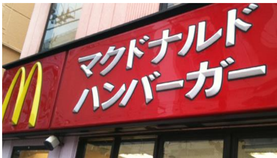
Figura 8 esempio di japanglish (makudonarudo)

Con il tempo però, questa necessità comunicativa è andata lentamente scemando, fino ad arrivare ai giorni nostri, dove fortunatamente il bisogno comunicativo è soddisfatto dall'uso di una lingua franca. Negli ultimi anni infatti, il crescente utilizzo di questa sub-lingua che è il japanglish non è più frutto di un'impellente esigenza di comunicare; deriva infatti dalla voglia di usarlo per sentirsi più occidentali, come conseguenza del continuo richiamo all'occidente oramai per moltissime cose, specialmente per pubblicizzare prodotti.