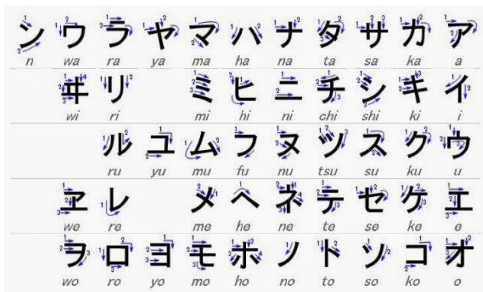
Figura 9 カタカナの早見表です。

片仮名(カタカナ)は日本語の表記体系に使われる音節文字です。仮名の1種で、借字を起源として成立しました。吉備真備(695 - 765)がカタカナを作った人と言われています。カタカナは八世紀に作られました。むかしおぼうさんはこの仮名を使っていました。今日は、カタカナが外来語の単語に使われます。それに、